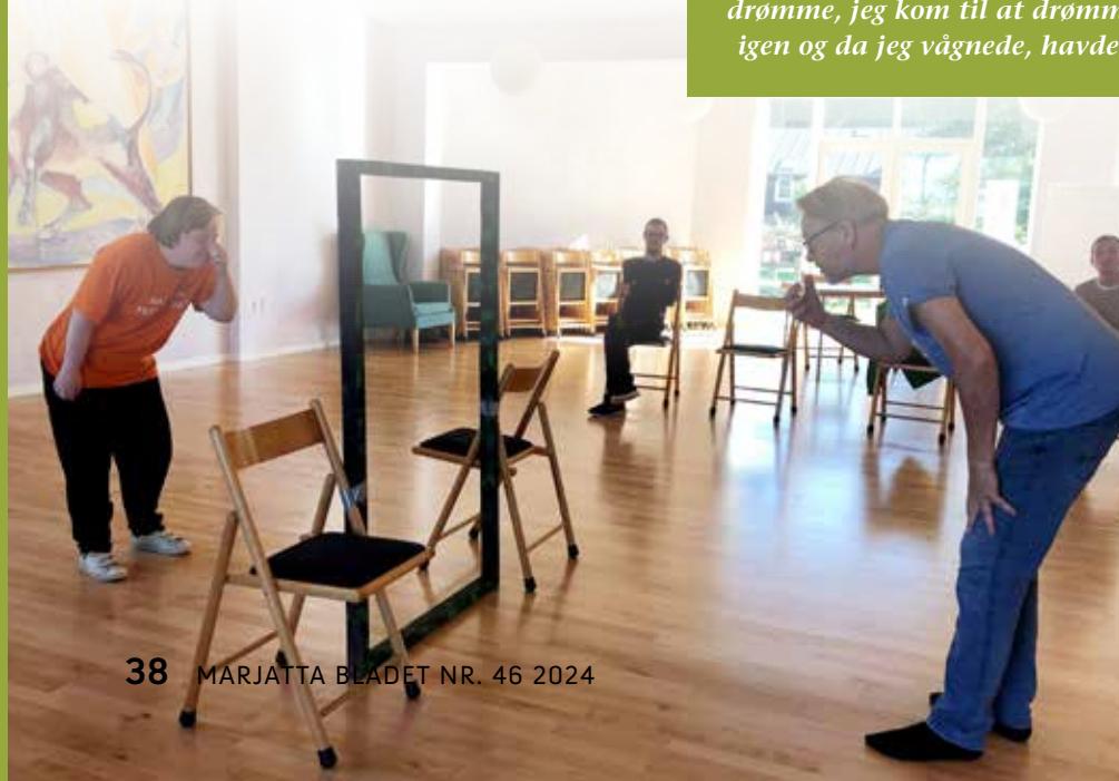
Stine: har skrevet meget af teksten, en hel masse om mine drømme, jeg kom til at drømme om heste og så faldt jeg i søvn igen og da jeg vågnede, havde jeg drømt om en bowlingkugle.

Det er mit håb, at vi med forestillingen har skabt nogle små klangbølger, som kan forsætte ind i fremtiden og vil medvirke til, at det kreative får endnu højere genlyd og prioritering.