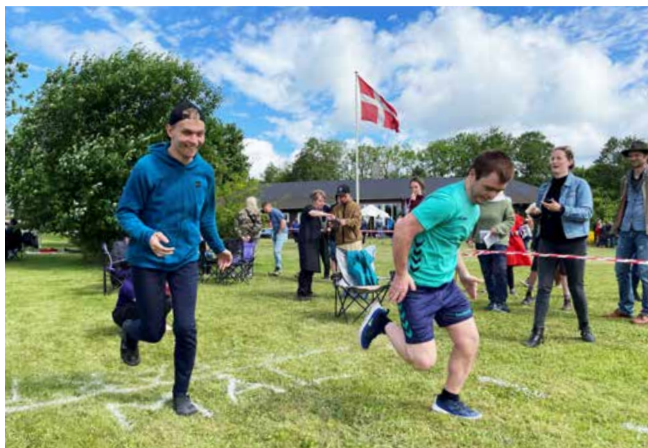
Glade deltagere fra Idrætsdagen på Vidarslund